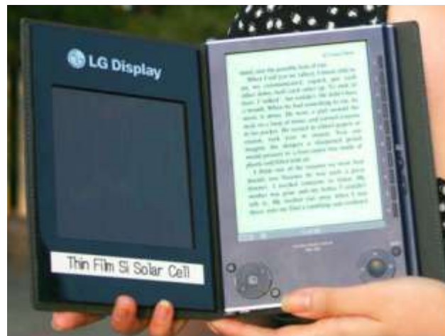
Una ampliación del mismo prototipo

Lo que si sabemos es que su lanzamiento está planificado para el 2012.