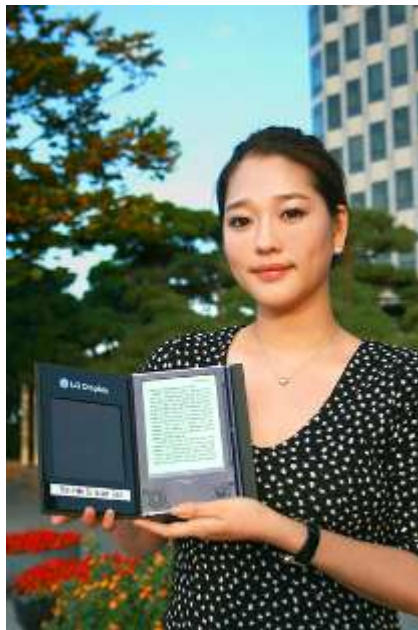
Prototipo mostrado en octubre 2009 montado sobre un Sony

Finalmente LG ha lanzado un comunicado de prensa en el que manifiesta que está trabajando en un lector electrónico con una película fotovoltaica de sólo 10 centímetros de ancho, con un espesor de 0,7 milímetros y que pesa solamente 20 gramos.