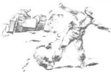
En el Coll del Cosso se luchó contra el hambre y la miseria. Así lo dice el XV Cuerpo.